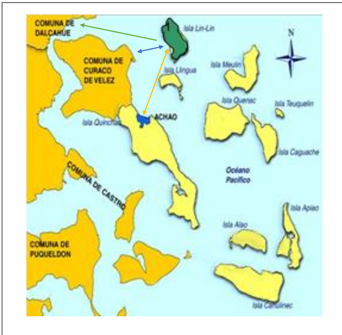
DIAGRAMA FLUJOS DE MOVILIZACIÓN AL EXTERIOR DE LA ISLA