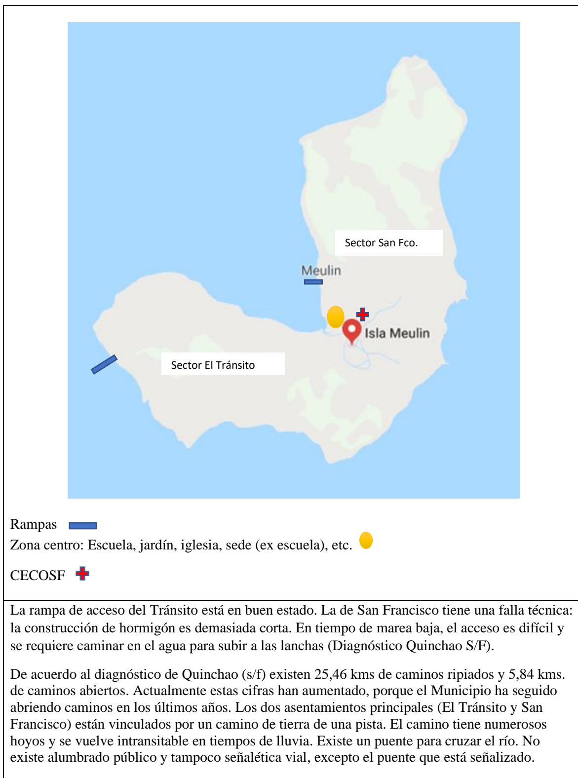
DIAGRAMA FLUJOS DE MOVILIZACION AL INTERIOR DE LA ISLA